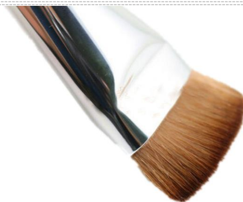
Dégraissage avec brosse