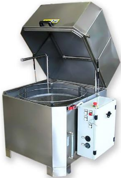
Panier à rotation ou en translation